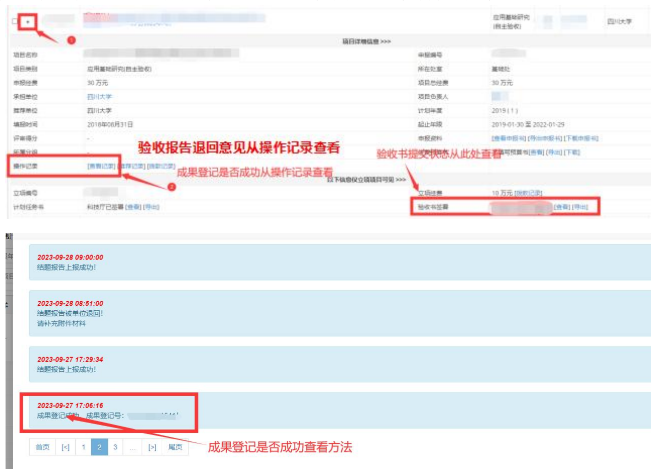
图 2 科技厅系统成果登记状态查询及截图示例